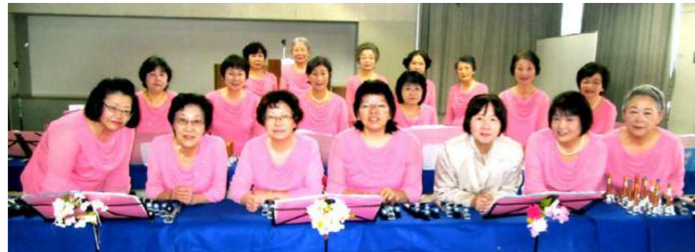
「さあこれから講座を楽しく始めようね」と笑顔でバチリ