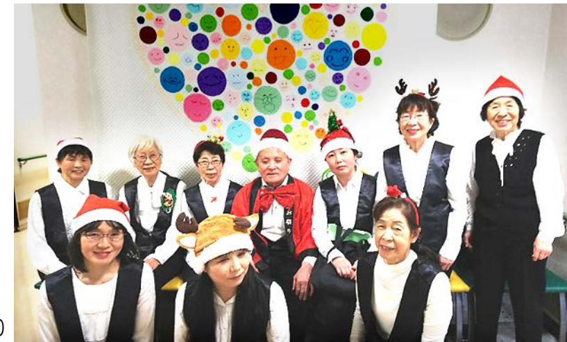
コンサートも無事終了しほっと一息